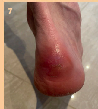
▲ Fotos: 1. Tryksår forårsaget af støvle 2. Dybere vævskade 3. Blottet achillesene 4. Stagnering i helingen 5. Efter opstart af specialiseret behandling 6. Endelig fremgang og på rette vej 7. Heling